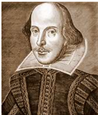
William Shakespeare (De Droeshout Gravure, titelpagina First Folio, 1623)

Toen Shakespeare nog leefde, mochten vrouwen geen toneel spelen. Dat werd pas mogelijk in 1660. Het is belangrijk om te weten dat alle vrouwenrollen toen gespeeld werden door jongens: dat zorgde soms voor grappige situaties en veel humor! Enkele van de bekendste toneelstukken van William Shakespeare zijn "Measure for Measure", "A Midsummer Night's Dream", "Hamlet", "Othello" en "King Lear".